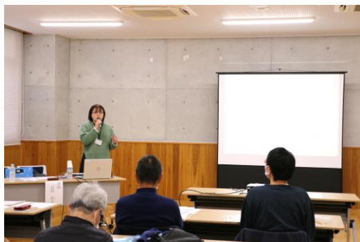
▲ 障害者差別解消研修会の様子

12月2日(火)、総合福祉センターふじみ2階会議室にて、山梨県障害福祉課障害者差別解消推進員に講師を依頼し『障害について学ぼう!!～やさしい心から、やさしい社会へ～』を開催しました。当日は、障害当事者・ご家族・地域の支援者・企業の方など20名が参加し、障害者差別解消法や障害について学び、理解を深める機会となりました。参加の方より「誰もが生きやすい共生社会を築くためにも、障害者について知ることの重要性を知れて、良い機会になりました。」等の感想を頂きました。住民同士がともに学び・交流できる機会を設けていくことの大切さを再確認し、よい学びの時間を創ることができました。