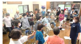
▲ 看護師や理学療法士によるフレイル予防体操を実施している様子

各地域で活動するサロンなどに、行政などと連携し、医療や介護等の専門職の講師を無料で派遣し、フレイル予防(測定なども含む)や認知症予防、健康体操の指導や人生会議などの普及活動を行っています。