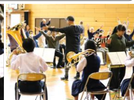
▲西中吹奏楽部の演奏や生徒と地域の高齢者が一緒に体操する様子

生活支援体制整備事業(支え合い地域づくり活動)、協議体の活動に興味のある方は生活支援体制整備事業担当まで