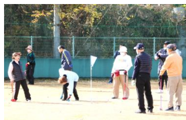
▲集合写真とグラウンド・ゴルフで地域が違うもの同士交流する様子