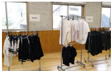
▲昨年のイベントの様子