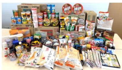
▲寄付をいただいた食品の一部

10月16日(水)～11月14日(金) 冬のフードドライブを実施し、集まった食品の一部をフードバンク山梨様へ寄付しました。温かいご支援、ご協力ありがとうございました。