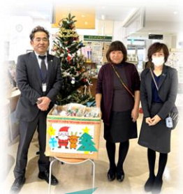
明治安田上野原営業所よりプレゼント提供

子どもの学習支援についてのお問い合わせは市社協生活困窮自立支援事業担当まで☎(63-3444)