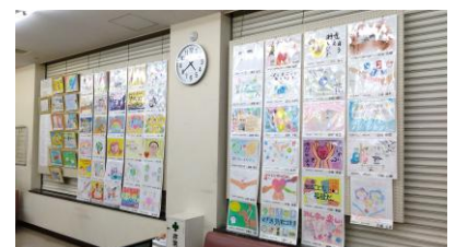
◀▲ 作品展示の様子 (上: 山梨中央銀行上野原支店 左: 総合福祉センターふじみ)

○ 展示のお知らせ 上野原市役所1階エントランス 1月19日(月)~2月13日(金)