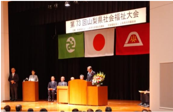
▲第73回山梨県社会福祉大会 表彰式の様子