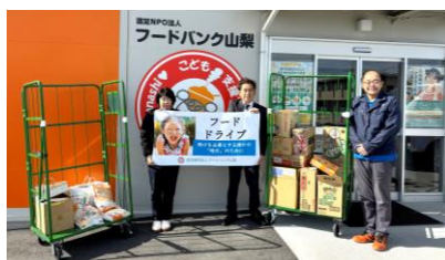
▲フードバンク山梨様へお届けの様子