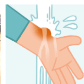
▲様々な対処法を学ぶ参加者の様子(※イラストはイメージ)