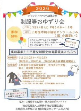
▼おゆずり会チラシ