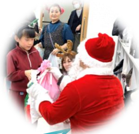
サンタさんから子どもたちへのクリスマスプレゼント