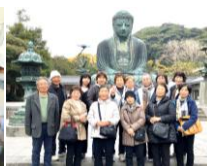
▲ 西原まつりのおやきづくりの様子と慰労会の様子(鎌倉散策)