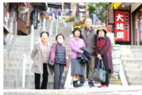
▲モニュメントで記念写真と伊香保の石段街を散策する様子