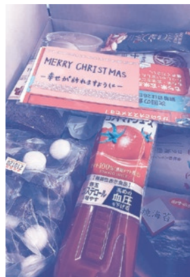
このように箱詰めされ配送されているそうです!