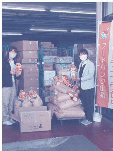
フードバンク山梨へお届け