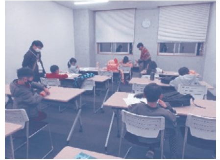
普段の教室の様子 勉強頑張っています

12月終わりの教室にサンタクロースがやってきました! みんな大喜び! サンタはケーキとクリスマスブーツをプレゼントしてくれました!