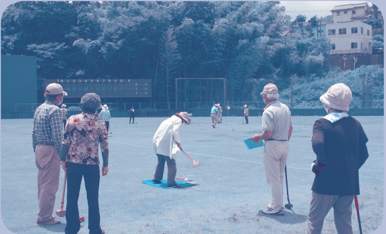
6月24日(水)新型コロナウイルス感染予防対策を講じながら、健康づくり事業「グラウンド・ゴルフ教室」を実施しました。