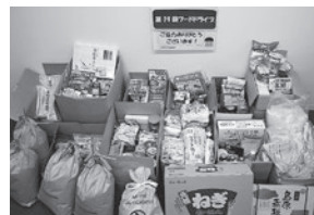
お米の寄附も沢山いただきました!!