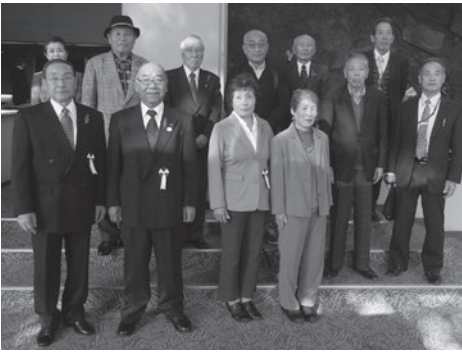
上野原より山梨県社会福祉大会へ出席された被表彰者と市社協理事

平成30年11月28日(水)に第66回山梨県社会福祉大会がコロナ文化ホールで開催されました。大会の席上、今日まで社会福祉の発展に功績のあった個人・団体に對し、表彰が行われ、市社会福祉協議会からは個人2名と1団体が受賞されました。