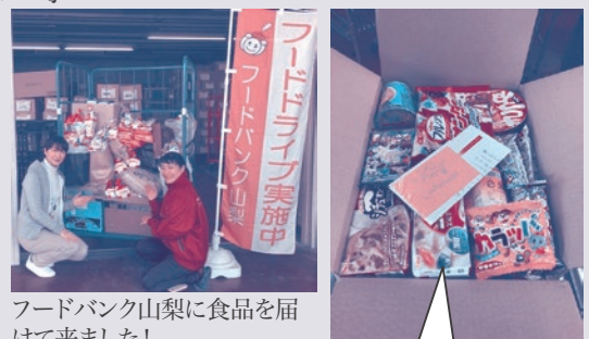
フードバンク山梨に食品を届けて来ました!

各家庭のニーズに合わせた食品が梱包され、メッセージカードを添えてお送りしているそうです!