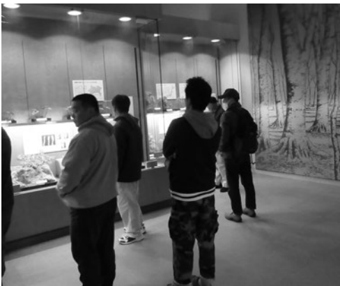
生命の星・地球博物館を見学する参加者

当日は46名が参加し、神奈川県立生命の星・地球博物館を見学し、鈴鹿かまぼこの里で昼食をとりました。参加者からは「珍しいものが見られてとても素晴らしかった。」などの意見が聞かれ、ゆつくりとした時間の中、交流を図ることができました。