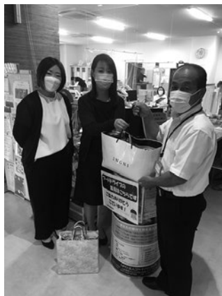
明治安田生命上野原営業所様より