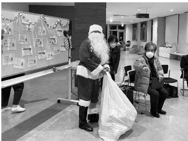
▲上野原ライオンズクラブによるクリスマス会の様子

上野原市からの受託事業で行っている、こどもの学習支援教室「オアシス」に、サンタクロースがやってきました。今年は「上野原ライオンズクラブ」の企画・協力で実現し、サンタさんからたくさんのプレゼントと温かいクリスマスチキン、ケーキをいただきました。