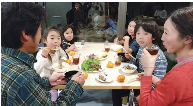
▲食事を楽しむご家族の様子

コロナ禍により、活動を自粛している期間がありました。再開を求める声を受け、対策を徹底し、満を持して令和4年4月より再開いたしました。