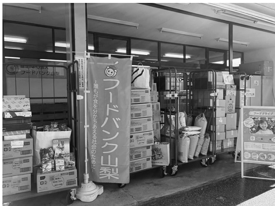
フードバンク山梨へ寄付食品をお届けしました!

この度市社協では11/1～11/16の2週間、フードドライブを実施し、一部をフードバンク山梨様へ寄付しました。個人の皆様、各団体様からまとまった食品寄付のご協力をいただき、今回は、50件以上、総重量500キログラムとなりました。皆様のご協力、誠にありがとうございました。