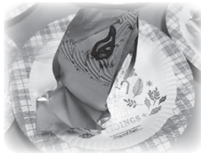
▲美味しいケーキが振る舞われました