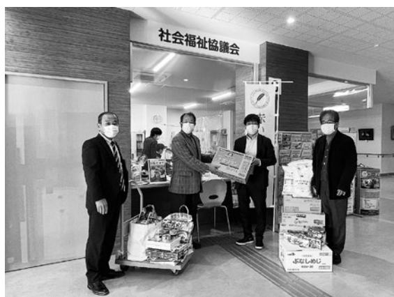
上野原ライオンズクラブ様より