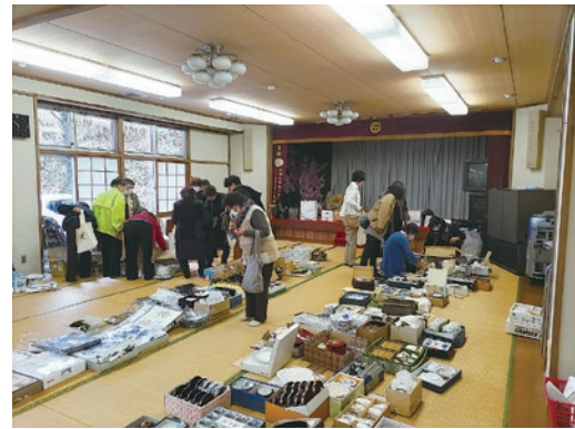
◀ひなづるの会によるバザーの様子(バザーの品物はひなづるの会を中心に、秋山地域から集められました。)