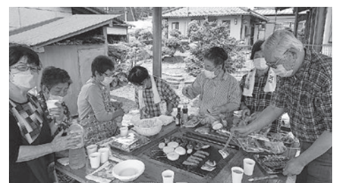
▲バーベキューの様子

地域の子育てサロンや高齢者サロンに参加してみませんか？市社協ではサロン団体の紹介やサロン活動支援を行っておりますので、お気軽にお問い合わせください。