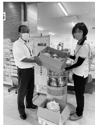
北都留地区退職現職女性 教職員の会様より