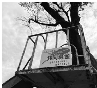
▲羽佐間集会所前 危険木伐採