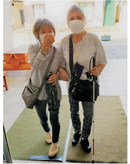
▲市立図書館にお付き添いされた時の様子

【市基幹相談支援センターより】 上野原市には障害をお持ちの方が使える福祉サービスが沢山あるとは言えない状況です。そんな中、視覚に障害を持つ方が受診や買い物の際、視覚の代わりに案内をするガイドヘルパー事業所が閉所してしまい、今後どうしたらいいのが困っていました。そんな時、ボランティアセンターに相談し、素敵なボランティアさんとおつながることができ、本当に良かったです。