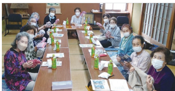
編み物を持って一枚!

また、「上野原市の中の新区」という視点も取り入れており、「上野原市の中で新区サロンとしてできること」として、上野原福祉作業所に搬入するペットボトル収集も熱心に取り組まれています。