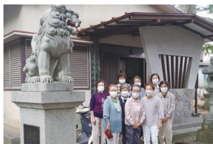
狛犬に見守られながら活動されています