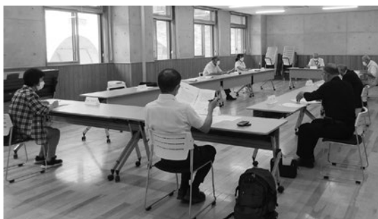
▲第4次地域福祉活動計画第1回策定委員会の様子

本会では、すべての市民一人ひとりが安心していきいきと暮らすことができるよう、その実現に必要な具体的施策等を取りまとめた「上野原市社会福祉協議会第3次地域福祉活動計画」を策定しております。この計画の期間が(平成30年度～令和4年度)であり、本年度が最終年度となります。そのため、地域の福祉関係者を中心に第4次地域福祉活動計画策定委員会を立ち上げて、現行計画の取り組み状況の評価やアンケートの調査・分析などを行い、次期計画の策定を進めております。