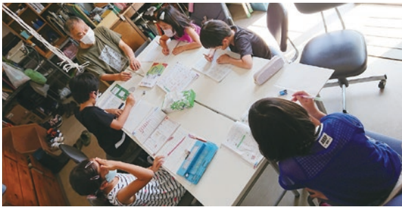
▲教室に集まり、一緒に勉強を進めている様子

無料塾×子ども食堂として、毎月第2・4土曜日の午前10時～16時に活動を行っております。勉強が楽しくなるように一緒に勉強をし、昼食やおやつ、お茶などを提供しています。勉強と遊びにメリハリをつけ、子ども達が伸び伸び過ごせることに力をいれています。費用は一切かかりません。