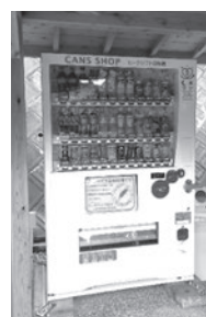
社会福祉法人 緑水会