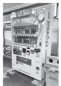
クレイン農協 上野原支店