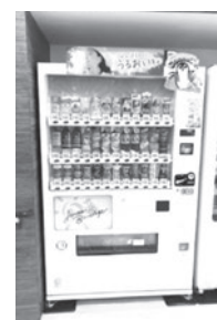
市総合福祉 センターふじみ