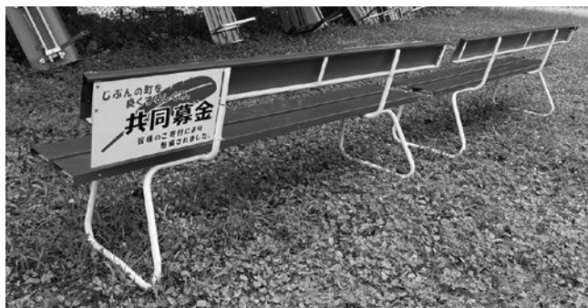
▲旧西原中学校グラウンド ベンチ設置