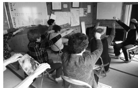
▲コロナ禍以前のサロン活動の様子

みんなで集まって顔を合わせる頻度は減りましたが、訪問活動により、仲間と支え合いながら地域で暮らす喜びも再確認でき、つながりを保つことができていると感じます。顔が思い浮かぶ関係性が「見守り・支え合い・つながり」の基本であると思います。コロナ禍という非常事態ではありますが、視点を変えた取り組みでつながりを絶やさない関係づくりが出来るといいですね。