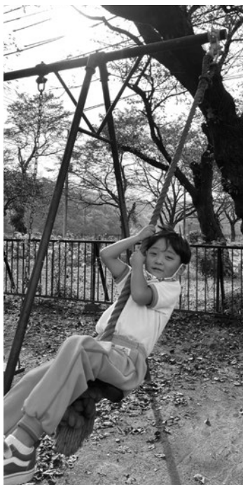
▲大野貯水池内公園 ロープ遊具の金具交換

子どもたちを中心とした交流が増えるよう遊具の修繕を行った地区や、地域の人が集まる集会所の危険木を伐採した地区、グラウンドゴルフ活動などの休憩のためにベンチを設置した地区がありました。