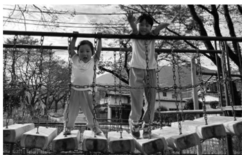
▲大野貯水池内公園 吊り橋の踏み板交換