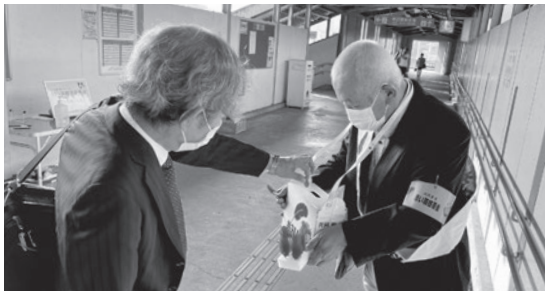
上野原駅での街頭キャンペーンの様子