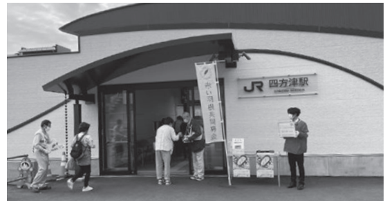
四方津駅での街頭キャンペーンの様子